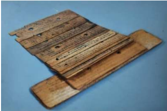
താഴെക്കാട്ടുപറമ്പിൽ വീടിന്റെ മച്ചിൽ സൂക്ഷിച്ചിരുന്ന താഴിയോലകളുടെ ഫോട്ടോ - വിഷയം - മർമ്മങ്ങളും - അടിതടവുകളും

ധീരന്മാരും, അധ്വാനശീലരുമായ ഗ്രാമീണർ ഇത്തരം പ്രതികൂല സാഹചര്യങ്ങളെ എപ്രകാരം നേരിടണമെന്ന് നന്നായി പഠിച്ചിരുന്നു. അന്നത്തെ നാട്ടു നടപ്പനുസരിച്ച് ആ പ്രദേശത്തെ നിയമ വാഴ്ച നിലനിർത്തിയിരുന്നത് അവിടുത്തെ പ്രമുഖരായിരുന്നു എന്ന് പ്രത്യേകം പറയേണ്ടതില്ലല്ലോ. അക്കാലത്ത് താഴെക്കാട്ടുപറമ്പിൽ കൊച്ചുവറീയ്ത് ധാരാളം പൊതുജന പിൻതുണയുണ്ടായിരുന്ന ഒരു മാനുവ്യക്തിയായിരുന്നു. അദ്ദേഹം കായികാഭ്യാസ മുറകൾ അറിഞ്ഞിരുന്ന ആളായിരുന്നു എന്ന് പിന്നീട് താഴെക്കാട്ടുപറമ്പിൽ നിന്നും ലഭിച്ചിട്ടുള്ള താളിയോല ഗ്രന്ഥങ്ങൾ സാക്ഷ്യം നൽകുന്നു. ചെന്തമിഴിൽ രചിച്ചിട്ടുള്ള താളിയോല ഗ്രന്ഥങ്ങൾ ഭൂരിഭാഗവും മലയാള വർഷം 1099 ലെ വെള്ളപ്പൊക്കത്തിൽ നാമാവശേഷമായി. ശേഷിച്ചവയിൽ ലഭ്യമായ താളിയോലകളിൽ ഒന്നിന്റെ ഫോട്ടോ താഴെ ചേർത്തിരിക്കുന്നു.